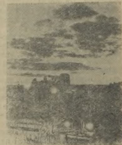
Оренбургские хлеборобы засыпали в закрома государства миллионы пудов зерна. Пошел хлеб с целины.

На снимке: ночная уборка в бригаде № 4 совхоза „Адамовский“.