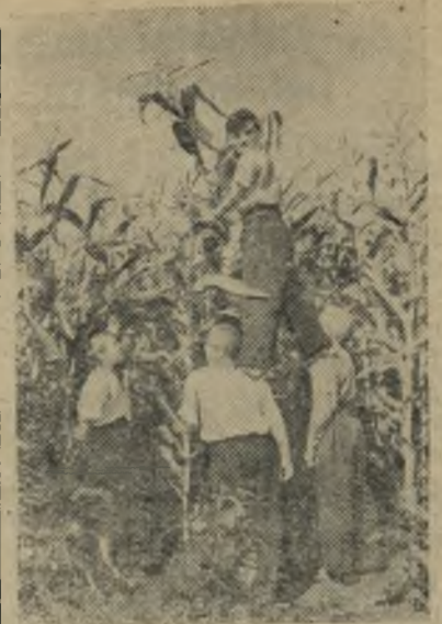
Алтайский край. Далеко в поле уходят границы пришкольного участка восьмилетней школы села Токарево Новокишинского района. Ребята здесь не только познают секреты земледелия, но и помогают родному колхозу в выращивании семян перспективных сортов зерновых, кормовых и овощных культур.

Отличную кукурузу вырастили школьники. Средняя урожайность составит не менее 700 центнеров зеленой массы.