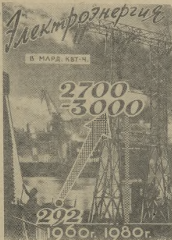
Фотомонтаж С. Андреева.