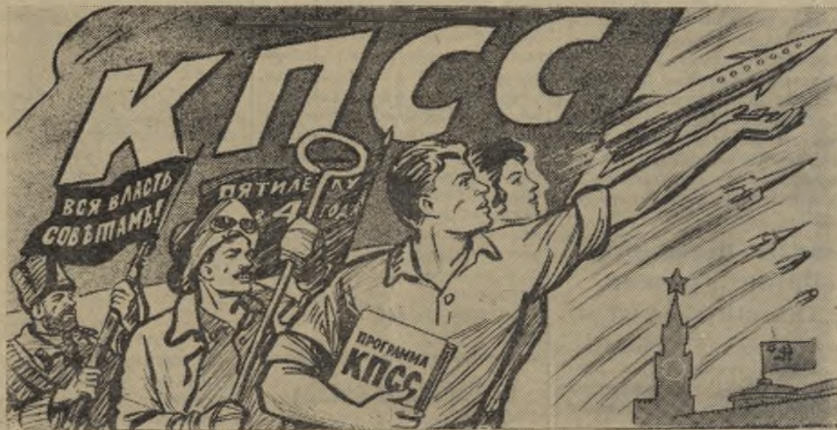
Рисунок В. Жарникова.

Т. КОМИНА, свиновод совхоза имени Ворошилова.