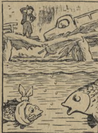
Опять попал в безызвестное положение!

Материалы, опубликованные на этой странице, подготовлены нештатным отделом культуры и быта.