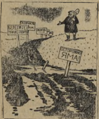
Все меры по безопасности движения автотранспорта приняты...

В. ПОЛИКАРПОВ, заместитель начальника эксплуатации автохозяйства.