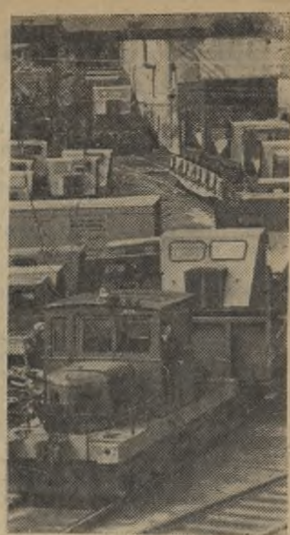
Карельская АССР. Соревнуясь за достойную встречу XXII съезда КПСС, коллектив Онежского тракторного завода с честью выполняет принятые обязательства. Ежедневно завод отгружает леспромпхозам сотни трелевочных тракторов «ТДТ-40».

На снимке: отправка готовых тракторов «ТДТ-40».