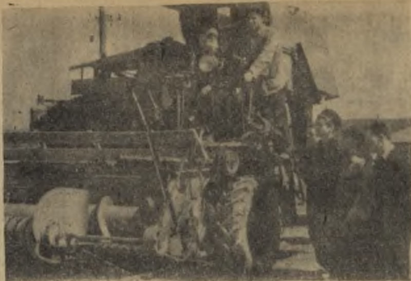
Ежегодно курсанты училища механизации проходят производственную практику в совхозах района.

Конструкторы и технологи завода работают сейчас над тем, чтобы еще более увеличить межремонтный период службы трактора.