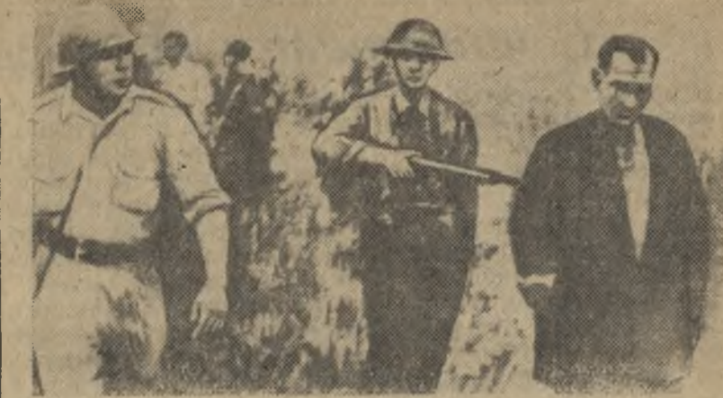
Этот снимок доставлен в английскую газету «Дейли Уоркер», несмотря на строгости салазаровской цензуры. Португальские солдаты ведут взятого в плен анголезца. Тысячи пленных анголезцев были расстреляны салазаровскими солдатами.

Конференция обсудит проблемы научного сотрудничества стран, ведущих исследования в Антарктике.