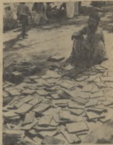
Республика Индия. Продавец книг на улицах Дели.

НЬЮ-ЙОРК, 24. (ТАСС). Сообщая из Вашингтона о вчерашнем совещании президента Кеннеди с его главными советниками и тремя сенаторами, газета «Нью-Йорк таймс» заявляет, что на этом совещании рассматривалось предложение о немедленных мерах по усилению военной силы США в Западной Европе. Тем не менее, по словам газеты, после совещания министр обороны Макнамара указал, что «было решено избегать пока наращивания вооруженных сил», Макнамара дал понять, что он не исключает возможности увеличения вооруженных сил США в Европе в будущем.