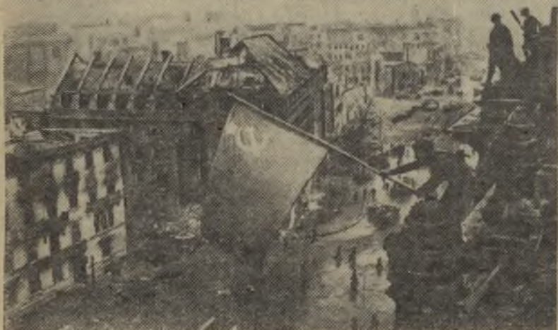
Водружение знамени Победы над Рейхстагом. 1945 год.