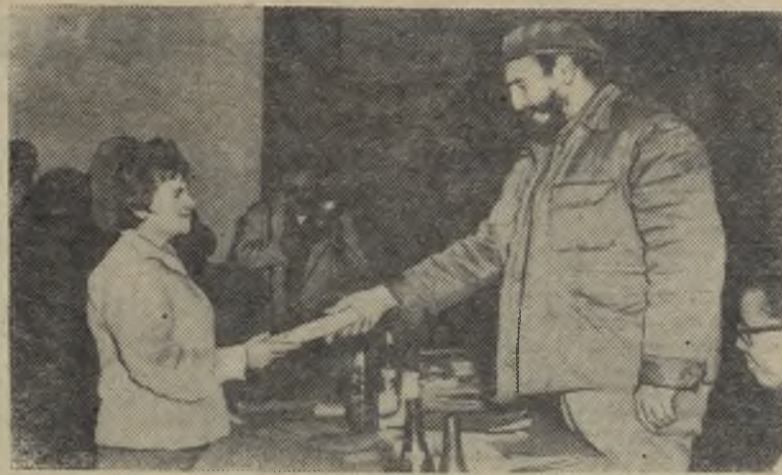
В Республике Куба этот год объявлен „годом образования“. В горах Сиерра Маэстра на курсах проходят специальную подготовку кубинские юноши и девушки — добровольцы. Они получают почетное звание учителей. Недавно состоялось торжественное вручение дипломов очередной группе учителей. На снимке: премьер-министр Фидель Кастро вручает дипломы учителям.

Мы «за», говорят миролюбивые кубинцы. Этот план пользуется полной поддержкой всех народов Латинской Америки.