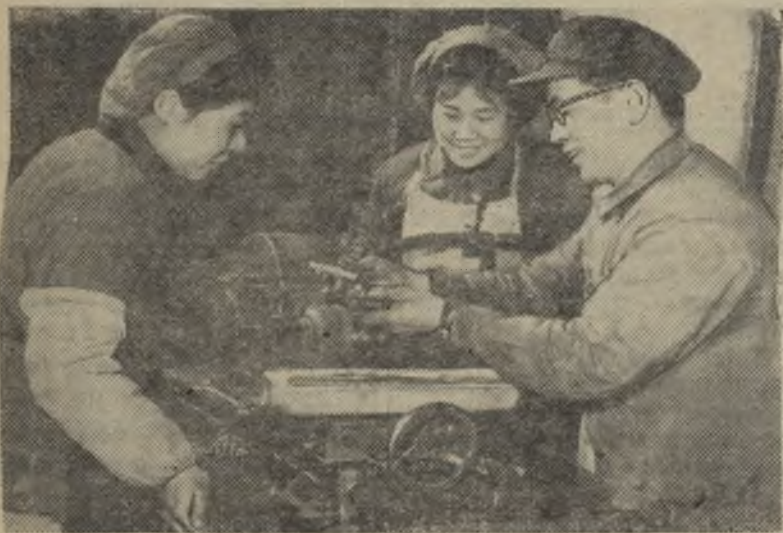
Китайская Народная Республика. Шлифовщики Напкинского завода мерительного и режущего инструмента создали недавно два бесцентровых шлифовальных станка, заменивших ручную обработку режущего инструмента. Новые станки значительно повысили качество обработки.

ДЕЛИ. «Хрущев в Вене», «Благоприятная атмосфера для встречи на высшем уровне», «Стремление к миру», «Надежда на урегулирование главных проблем» — гласят заголовки деловых газет. В многочисленных корреспонденциях из столицы Австрии выделяется заявление главы Советского правительства на венском вокзале о решимости Советского Союза добиваться ослабления международной напряженности и упрочить мир во всем мире.