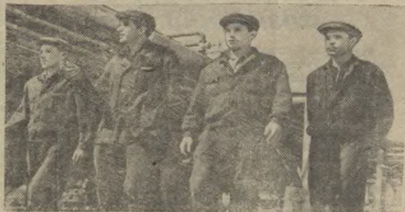
Куйбышевская область. На волжском гиганте—Ставропольском заводе синтетического каучука—пущен в эксплуатацию комплекс цехов по производству латекса.