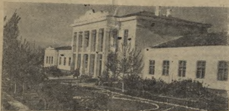
Краснодарский край. Больница станицы Старо-Нижестеблиевской Красноармейского района заслуженно считается одной из лучших сельских больниц Кубани. Она рассчитана на 75 мест, имеет физиотерапевтический и рентгеновский кабинеты, лабораторию, операционно-хирургическое, родильное и другие отделения. На снимке: главный корпус станичной больницы.