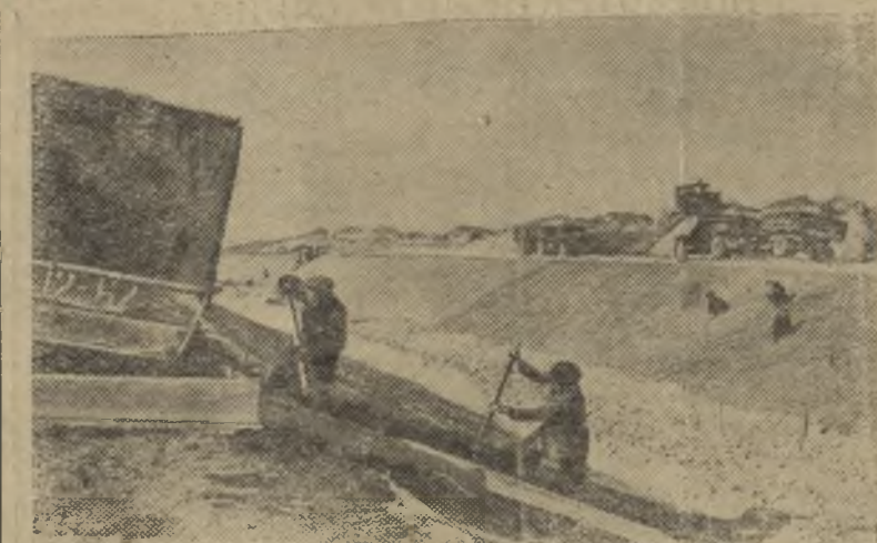
Казахская ССР. Грандиозные строительные работы ведутся в Голодной степи. За семилетку ирригаторам предстоит оросить свыше 70 тысяч гектаров плодородных земель. Для этого из Узбекистана от Южного Голодноостепенского магистрального канала прокладывается канал — Центральная ветка.

Уход за посевами гречи проводят с учетом почвенных и климатических условий. Если до появления всходов на посевах образовалась почвенная корка, посевы боронуют в один след поперек рядков