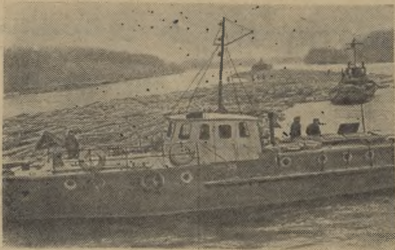
Башкирская АССР. В этом году весна пришла на Урал раньше обычного. На реках начался сплав леса. Недавно первые большегрузные плоты пришли в Уфу по центральной водной магистрали — реке Белой. На снимке: проводка по реке Белой плота объемом около 6 тысяч кубических метров древесины.