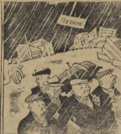
Рис. Е. Щеглова.

Потеряли копейку! Все ищут, все беспокоятся.