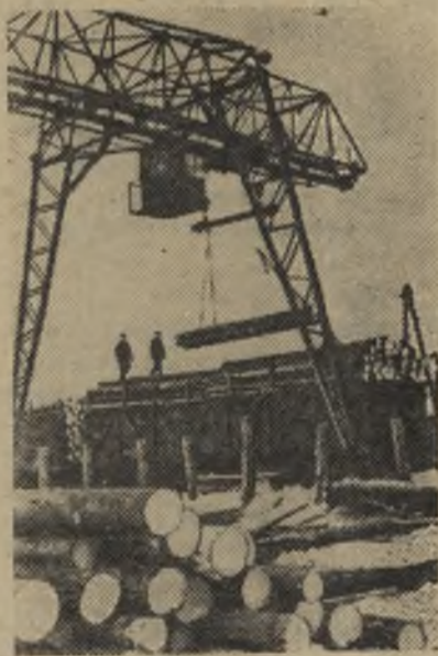
Карельская АССР. На нижнем складе Чална Шуйско-Виданского леспромхоза механизирована погрузка вагонов. Мощные краны значительно облегчают труд рабочих и повышают производительность труда. На снимке: погрузка леса.