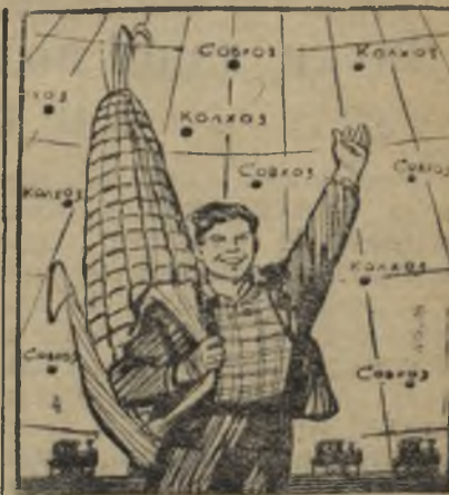
Молодежь — на кукурузный фронт!