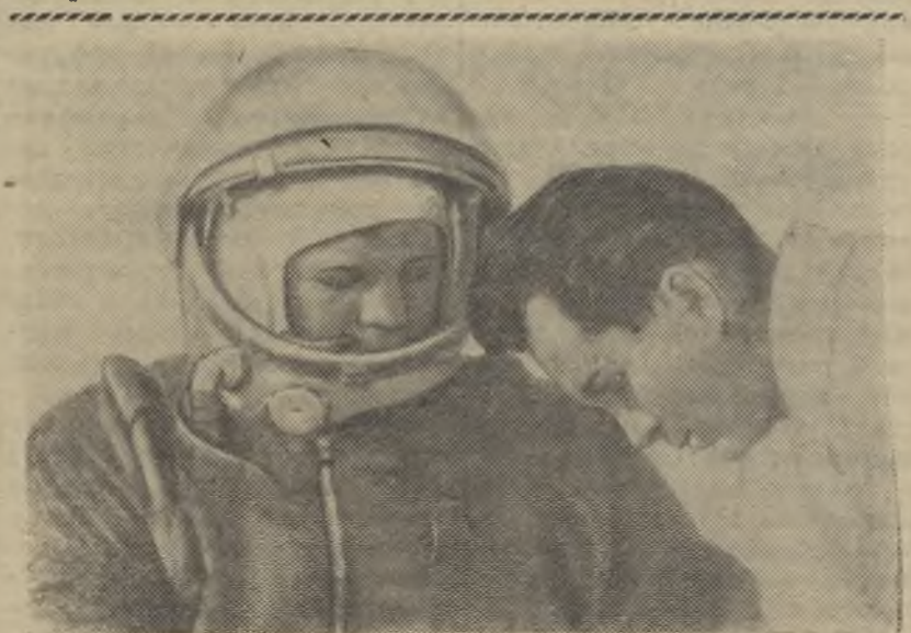
Первый в истории человечества космонавт Ю. А. Гагарин готовится к полету.

1939 ГОД. Поблескивая новой краской, «СТЗ-НАТИ», выбросив белое колечко дыма, замер у военкомата.