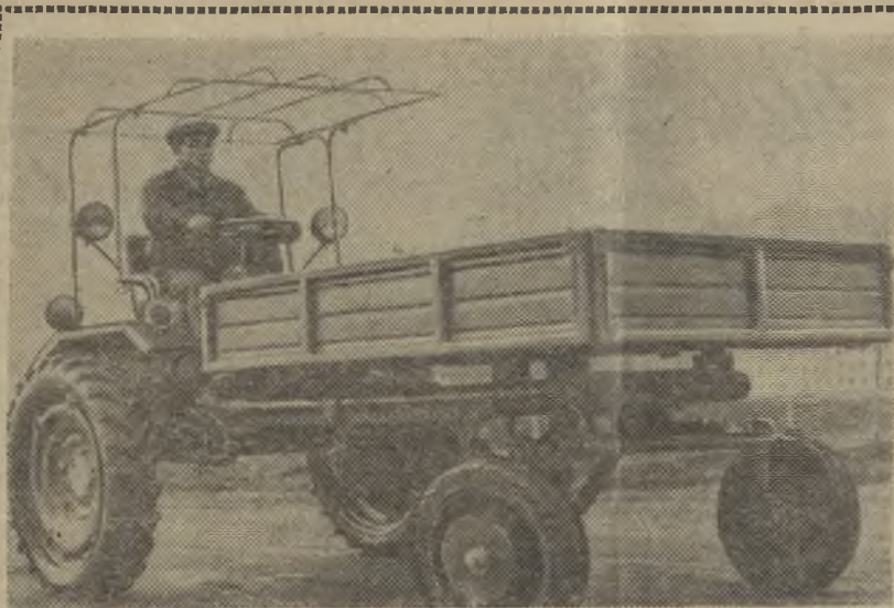
Рабочие и специалисты тракторных заводов Кореической Народно-Демократической Республики успешно справляются с поставленной перед ними задачей по механизации трудоемких процессов в сельском хозяйстве. Создаются новые машины и различные приспособления к имеющейся технике.

Близок день, когда вся Африка будет свободной.