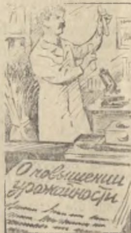
Диссертация председателя колхоза и ее защита Рис. С. Чистякова