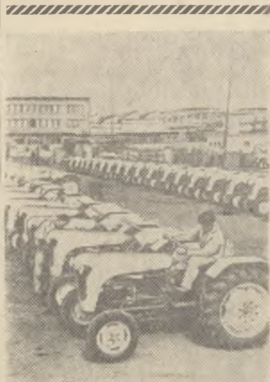
Польская Народная Республика. Тракторы марки „Урсус С-325“ во дворе предприятия „Урсус“.

Министр иностранных дел Косака, обеспокоенный этими сообщениями, поспешил вчера встретиться с американским послом. Он просил, как сообщают газеты, не «форсировать насильственным путем» возвращение долга.