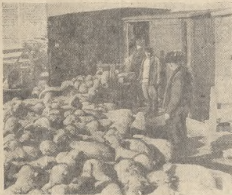
НАВСТРЕЧУ ВЫБОРАМ НАРОДНЫХ СУДОВ

На снимке: погрузка овец колхоза имени Казбекова Левашинского района в железнодорожные вагоны на станции Манас.