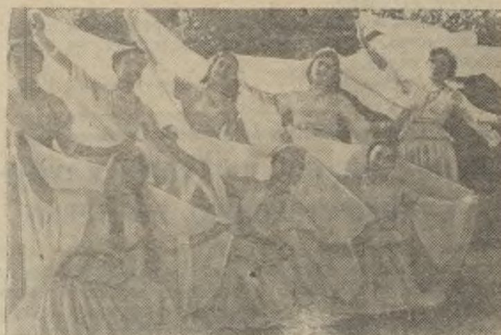
С неизменным успехом проходят выступления самодеятельного ансамбля песни и танца Бакинской обувной фабрики № 1. За два года существования ансамбль дал более ста концертов на предприятиях и стройках Баку, в пионерлагерях и колхозах. В программе коллектива песни и танцы народов СССР. Сейчас самодеятельный ансамбль выехал с концертами в города Нагорно-Карабахской автономной области. Деньги, собранные от концертов, обувщики решили сдать в фонд мира.

И. ЩЕРБИНА-САМОЙЛОВА. Кандидат физико-математических наук.