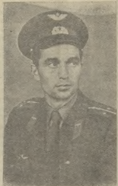
Капитан Василий Амвросиевич Поляков — военный летчик, сбивший американский бомбардировщик 1 июля 1960 года.