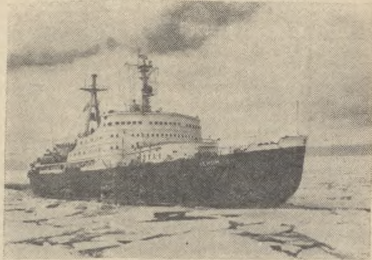
Атомоход „Ленин“ ведет свою первую ледовую разведку в полярном бассейне. На снимке: атомоход „Ленин“ во льдах Баренцева моря.