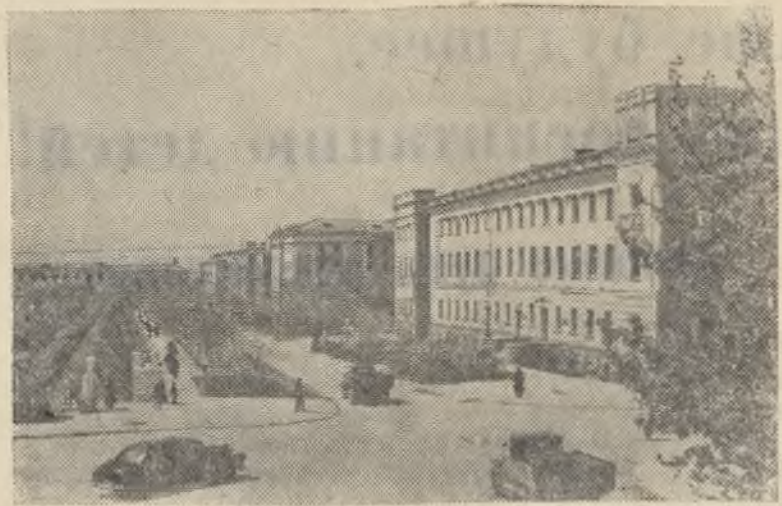
Караганда. С каждым годом растет и благоустраивается город, пышнее становится его зеленый наряд. На улицах и площадях, в парках и скверах высажены деревья и кустарники. НА СНИМКЕ: проспект Ленина.

Дело будет рассматриваться в Народном суде 2-го участка Режевского района.