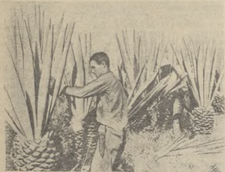
Республика Куба. Члены кооператива „Рене Аркай“ (провинция Пинар-дель-Рио) за сбором хенекена — волокнистого растения, из которого изготавливаются канаты.