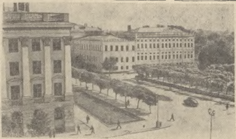
Казань. Слева — корпус химического факультета Казанского государственного университета имени В. И. Ульянова-Ленина, справа — здание Академии наук СССР (Казанский филиал).