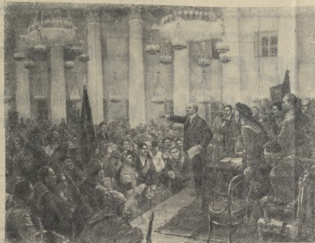
„Выступление В. И. Ленина на II Всероссийском съезде Советов“. Картина художника В. Серова.