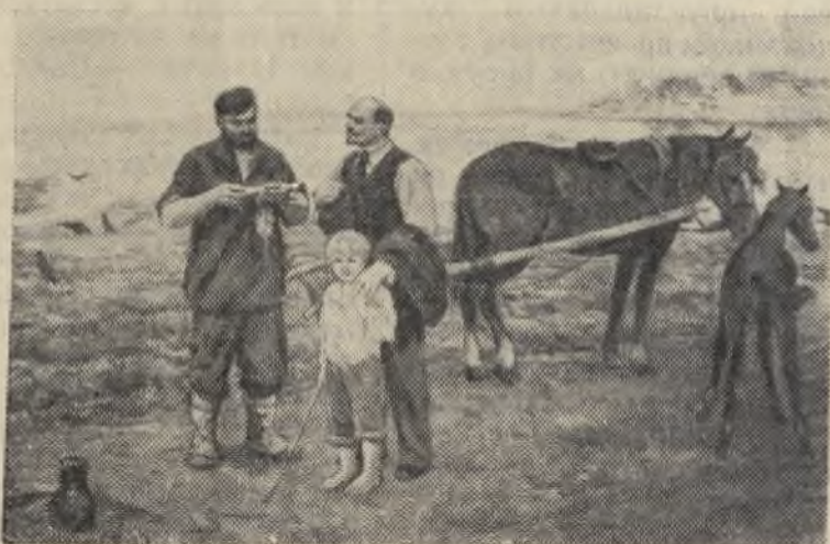
«Разговор о земле» Картина художника П. Ф. Судакова.