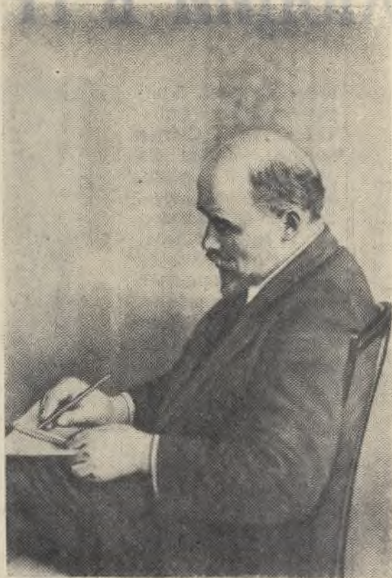
В.И. Ленин на конгрессе Коминтерна.

В наши дни путь Ленина сделался той столбовой дорогой, по которой шествуют миллионы в борьбе за мир, навстречу счастливому будущему человечества.