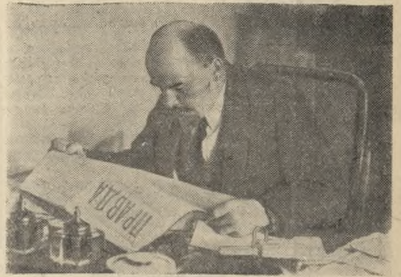
В. И. Ленин за чтением „Правды“ 1918 г.

Только при условии, когда вся советская общественность, весь советский народ под руководством партии возьмет дело охраны общественного порядка в свои руки и скажет грозное «нет» хулиганам, пьяницам и иным правонарушителям, будет обеспечен подлинно образцовый порядок, будут созданы условия для нормального труда и жизни советских людей, строящих коммунистическое общество.