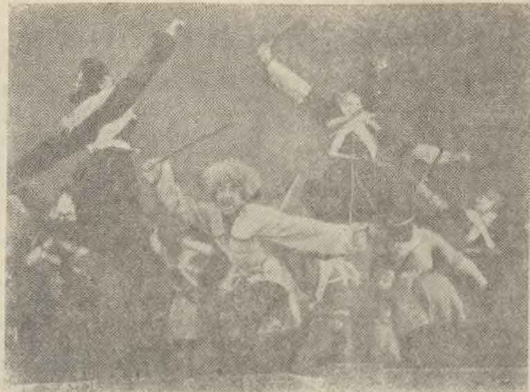
НА СНИМКЕ: «танец джигитов» из танцевальной сюиты «Партизаны».

хранения СССР в связи со значительной заболеваемостью полиомиелитом приняло решение привить население ряда областей и городов Советского Союза, в том числе и население г. Режа.