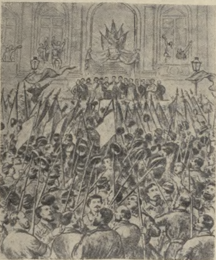
(Иллюстрация из журнала 70-х годов XIX века).

Дневной сеанс Приключение в Золотой бухте