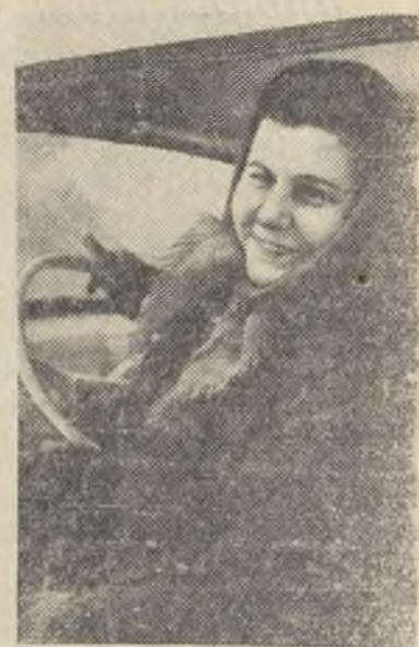
Германская Демократическая Республика. Крестьяне сельскохозяйственного производственного кооператива деревни Бёрли в районе Ошатц добились больших производственных успехов. В прошлом году по производству говядины и свинины на гектар полезной сельскохозяйственной площади кооператив перевыполнил плановые задания. Его доход превысил 1 миллион марок. Растет и материальное благосостояние членов кооператива.