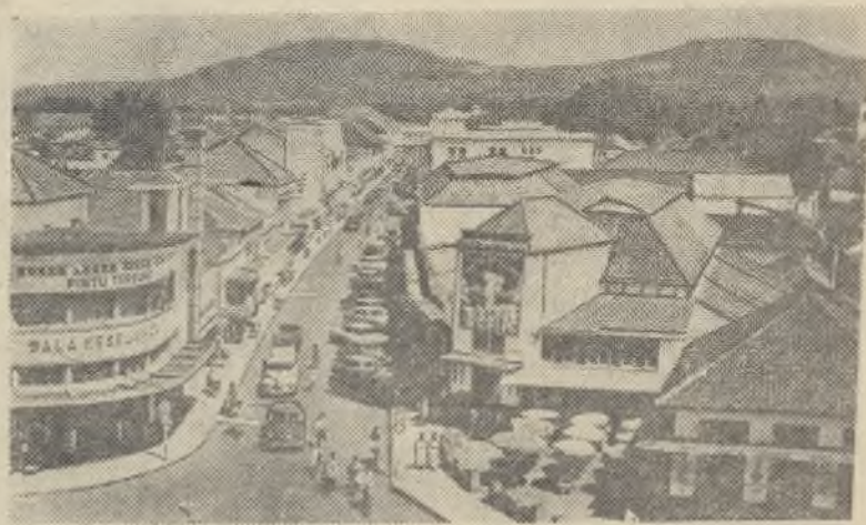
Индонезийская Республика. НА СНИМКЕ: улица Брага один из деловых и торговых центров Бандунга.