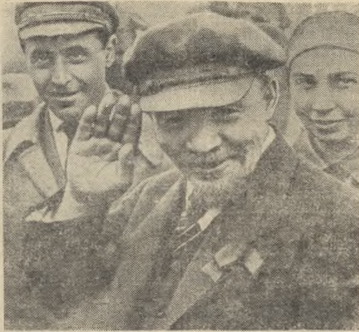
В. И. Ленин на закладке памятника «Освобожденный труд».

Москва, 1 мая 1920 года (киноадр). (Из альбома, подготовляемого к выпуску Институтом марксизма-ленинизма при ЦК КПСС).