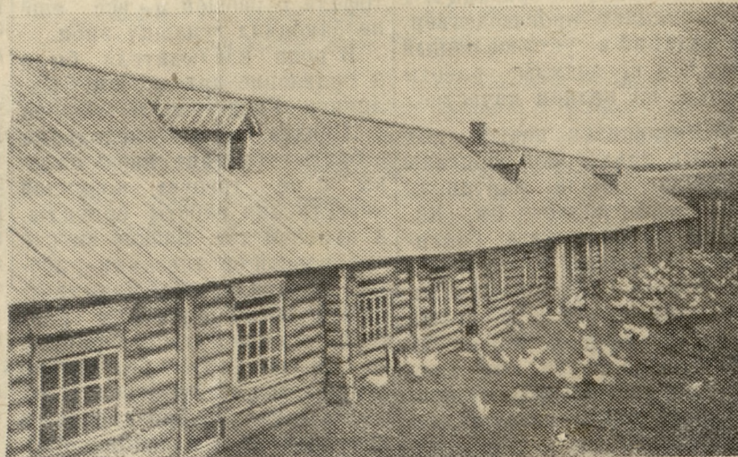
Сельхозартель им. Кирова в нынешнем году развернула большое строительство животноводческих помещений. Новый птичник построен в этом году на 1000 голов. На снимке: здание птичника.