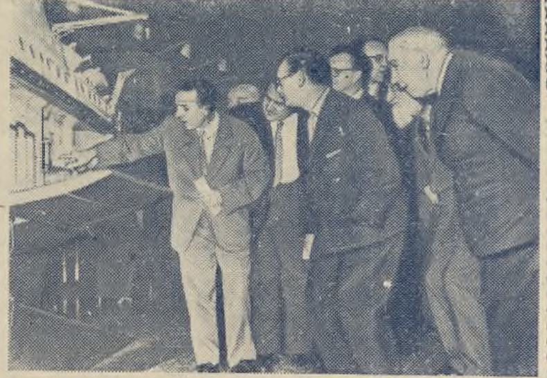
Дания. В Копенгагене открылась советская научно-техническая выставка по использованию атомной энергии в мирных целях. НА СНИМКЕ: у модели атомного ледокола „Ленин“.