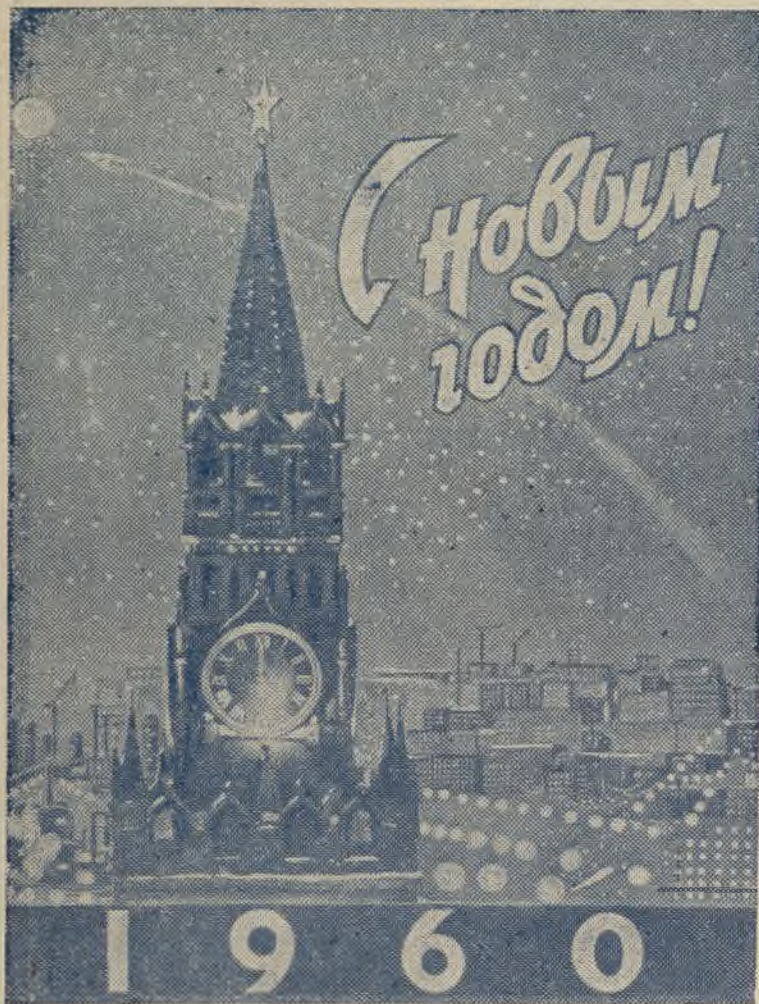
Фотомонтаж художника А. Перельмана.