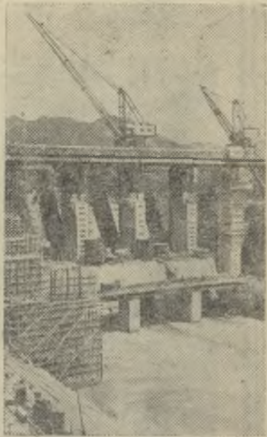
Китайская Народная Республика. На реке Синьаньцзян в провинции Чжэцзян сооружается гидроэлектростанция мощностью 650 тысяч киловатт. Созданная по проекту китайских инженеров станция даст первый ток в конце 1959 года.

На снимке: на строительстве электростанции.