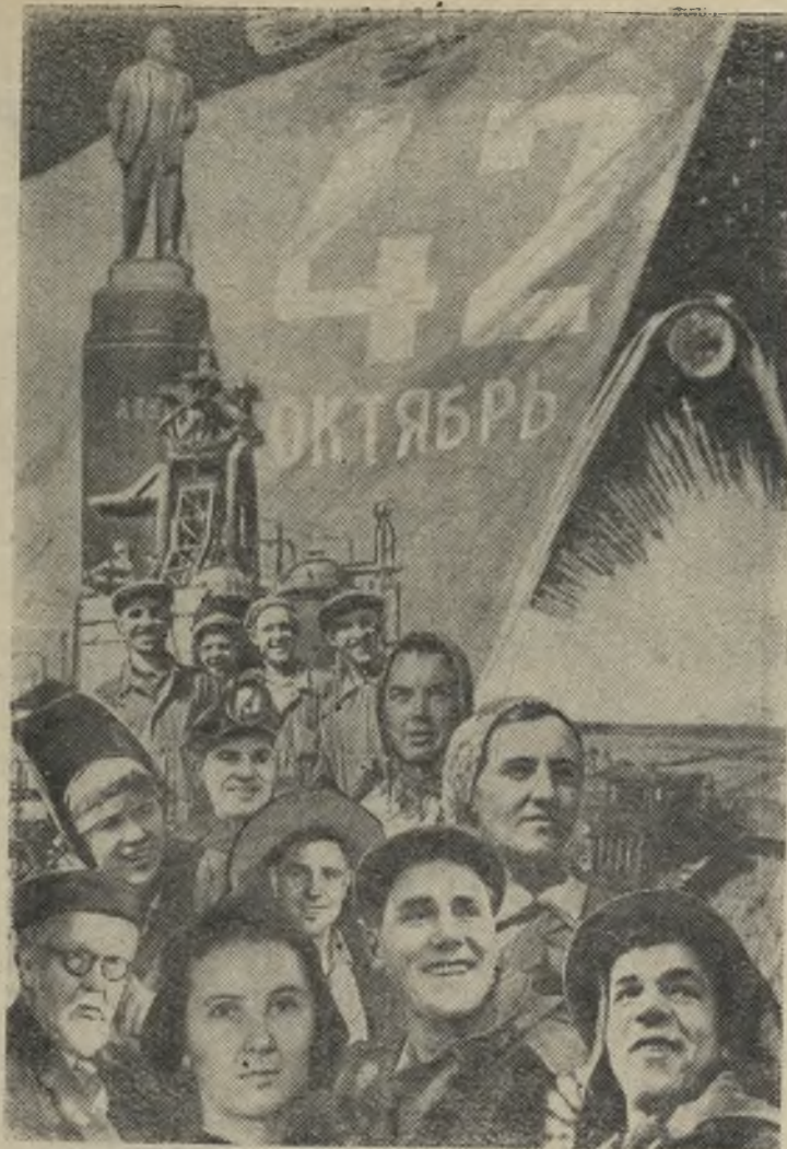
Фотомонтаж Б. Антонова.