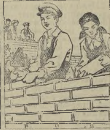
—А мы — школу.