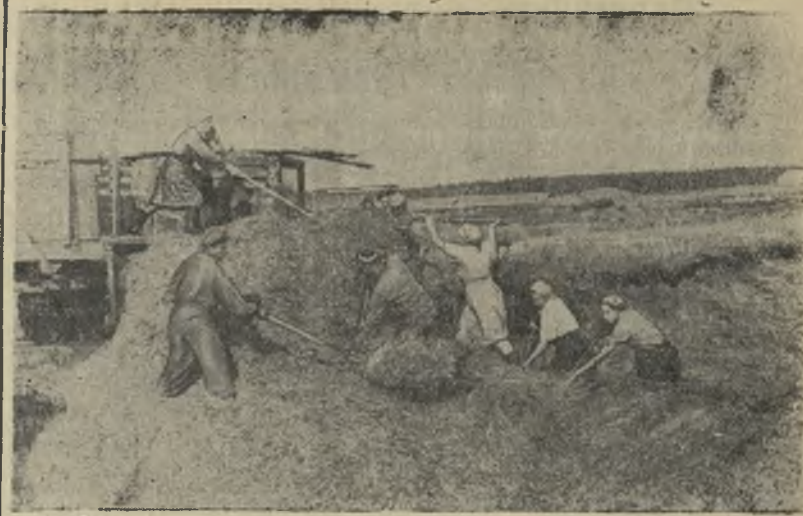
Колхоз имени Свердлова. В первой бригаде заложено на силос 800 тонн горохо-овсяной смеси. В настоящее время здесь идет усиленное силосование кукурузы.

Кипит работа на третьем производственном участке артели „Урал“. Надо успеть закончить в эти два