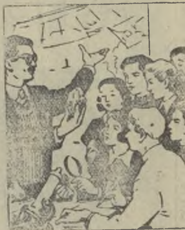
—Школа расширяет наши знания.

Значительную помощь своей школе в укреплении учебно-материальной базы оказывают учащиеся старших классов школы № 3. Их силами ведется строительство учебной мастерской, теплицы, парников.