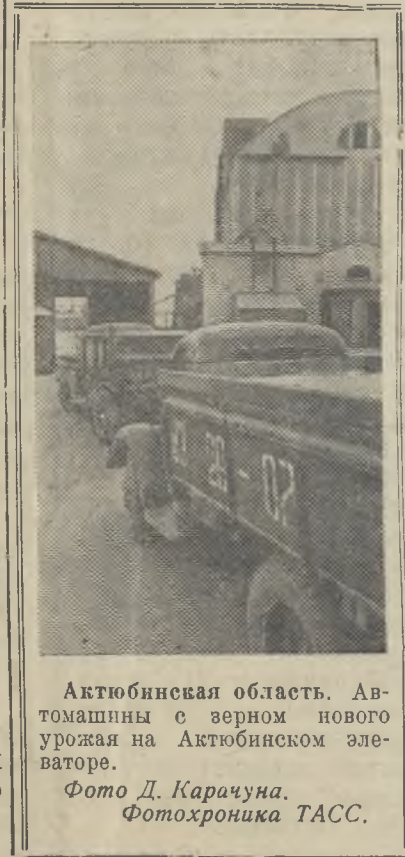
Актюбинская область. Автомашинны с зерном нового урожая на Актюбинском элеваторе.