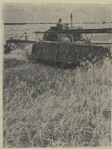
Запорожская область. Первомайский завод в гор. Бердянске готовит к выпуску новую рядковую безлафетную жатку „ЖРБ-4,9“ с шириной захвата 4,9 метра.