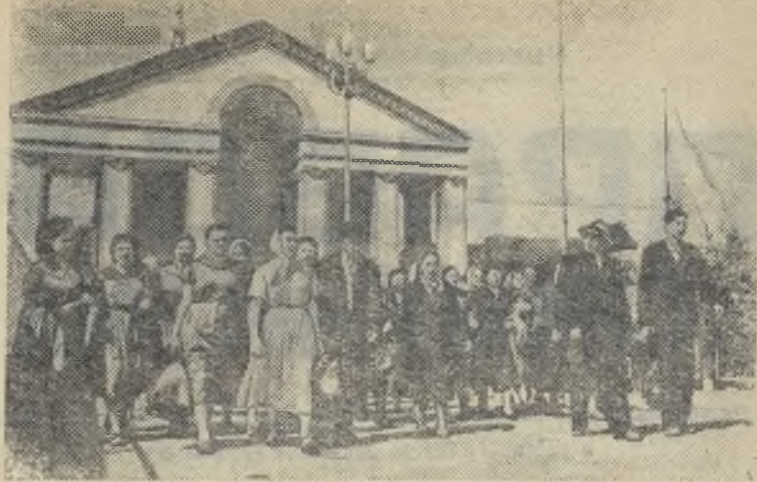
Москва. На Выставке достижений народного хозяйства СССР Группа колхозников из сельскохозяйственной артели „Красная зоря“ Кимрского района Калининской области.