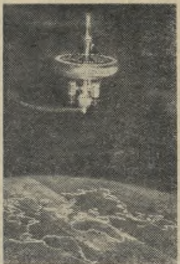
Москва. На Выставке достижений народного хозяйства СССР. В павильоне „Электрификация СССР“ демонстрируется действующая модель космической станции.

Бывшее помещение заводоуправления капитально ремонтируют и переоборудуют. В нем разместятся здравпункт и лаборатория завода.