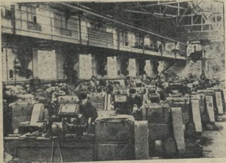
Румынская Народная Республика. Новый инструментальный цех железнодорожных мастерских „Травница-Рошия“ в Бухаресте.

Церемония открытия общества иракской дружбы вылилась в яркую демонстрацию прочной дружбы между народами Советского Союза и Ирака.