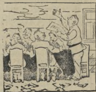
О прополке всесторонне Обсуждается вопрос,

свой счет решили построить школьные здания колхозы Инжавинского, Каменского, Никифоровского и других районов.