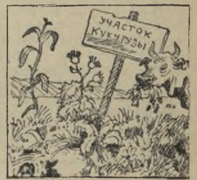
А участок кукурузы Сорняками весь зарос.