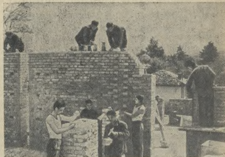
Народная Республика Болгария. Студенты строительного техникума имени Г. Димитрова в городе Тырново решили собственными силами построить новую школу.

Митинги индийско-китайской дружбы состоялись также в Калькутте, Мадрасе и других городах Индии.