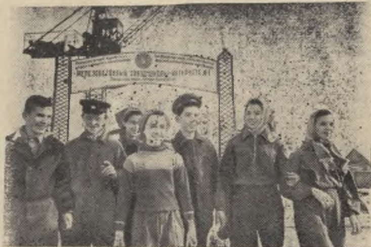
Николаев. На территории школы-интерната начал работать учебный завод железобетонных изделий. На школьном заводе трудятся учащиеся.