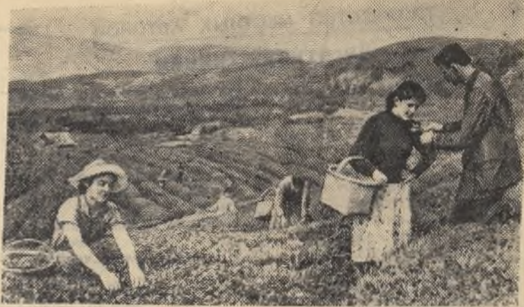
Грузинская ССР. На плантациях республики начался сбор зеленого чайного листа.

Нет слов, бригады неплохо берутся за дело. Но есть еще много такого, что мешает им развернуться в полную силу. Устранить все помехи, создать условия для плодотворного труда—долг горсовета, предприятий, учреждений и организаций, отвечающих за благоустройство города.