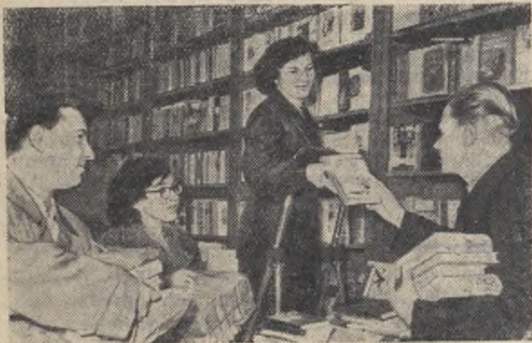
Ленинград. Хорошо организовано распространение книг на заводе „Светлана“. В прошлом году заводские общественники продали на своём предприятии 100 тысяч книг. Министерство культуры РСФСР и ЦК профсоюза работников культуры наградили 40 общественных распространителей книг почётными грамотами и значками „Пропагандисту книги“ (этим значком награждаются общественные распространители, которые лично распространили свыше 3 тысяч книг).

В настоящее время на предприятии около 100 распространителей. Некоторые из них уже продали по 5—9 тысяч книг.