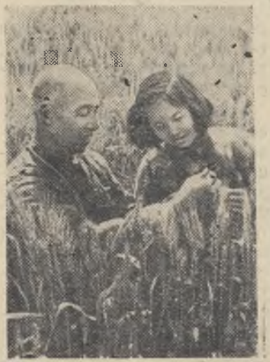
Китайская Народная Республика. В провинции Сычуань успешно продолжается рост ранних культур. Уже колосится пшеница, цветет сурепица. В народной коммуне Лохань в районе города Лучжоу на 113 гектарах ожидается хороший урожай пшеницы. НА СНИМКЕ: крестьяне осматривают посевы.