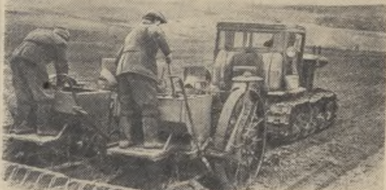
Ровенская область. В колхозе имени Парижской коммуны Дубновского района в разгаре весенние полевые работы. Здесь сейчас успешно ведется сев сахарной свеклы и посадка картофеля.

В первом году семилетки колхозники сельхозартели обязались вырастить на площади 310 гектаров в среднем по 398 центнеров сахарной свеклы с гектара и получить на площади 260 гектаров в среднем по 130 центнеров картофеля с каждого гектара.