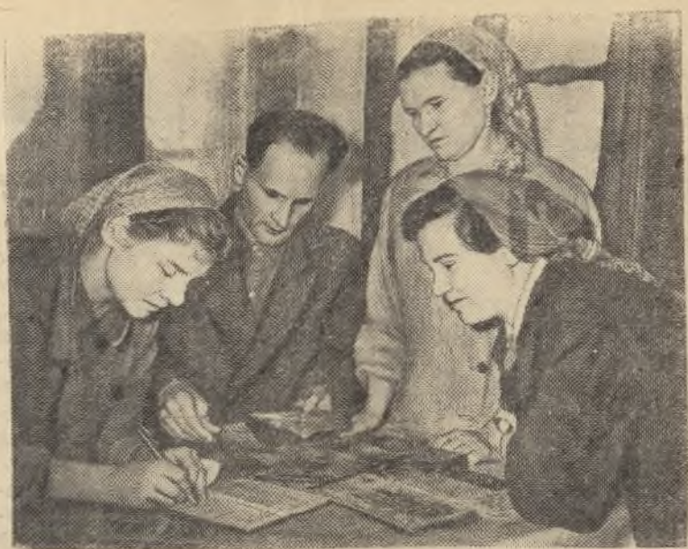
Ставропольский край. С января этого года колхоз имени Шаумяна Георгиевского района перешел на ежемесячную денежную оплату труда колхозников.

В результате этого мероприятия возросла материальная заинтересованность членов сельхозартели, повысилась производительность труда и увеличился их заработок.