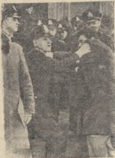
Канада. Недавно в Монреале полиция разогнала демонстрацию бастующих работников телевидения, пикетирующих у здания Канадской радиовещательной корпорации. Несколько участников было арестовано.

Сроки приема заявлений и сдачи вступительных экзаменов в заочные и вечерние высшие учебные заведения в основном сохранились прежние с незначительным уточнением и изменением их для ряда вузов.