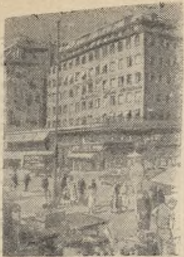
Швеция. Стокгольм. На одной из площадей.