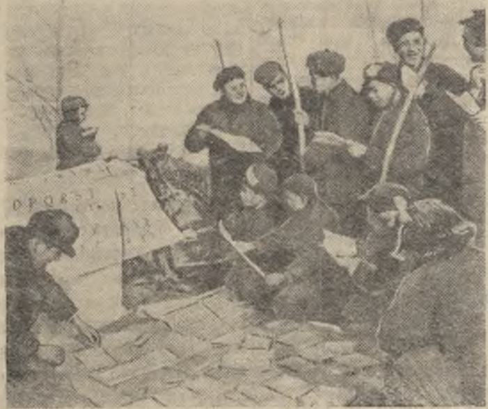
В Китайской Народной Республике проводится большая работа по ознакомлению населения с реформой письменности. Организована продажа таблиц алфавита и книг, написанных новым алфавитом.

На снимке: разносчик-книгоноша в одном из производственных сельскохозяйственных кооперативов в пригороде Сианя (Северо-Западный Китай).