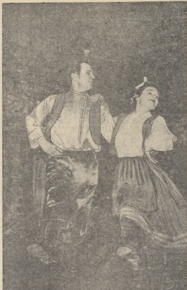
Участники художественной самодеятельности.