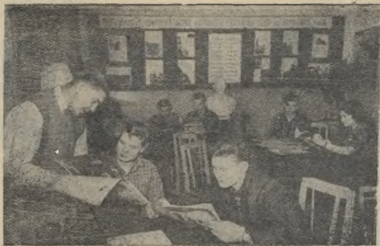
На агитпункте при городском Доме культуры.