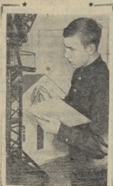
Орел. Строительное училище № 2 подготовило сотни молодых плотников, каменщиков, штукатуров, маляров, арматурщиков. За два года учащиеся получают профессиональные навыки и общеобразовательную подготовку.