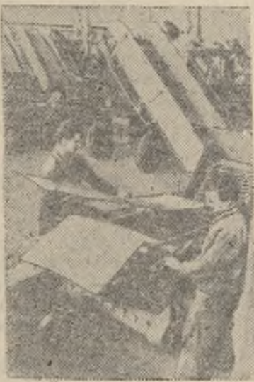
Завод сельскохозяйственного машиностроения „Боденбербайтунгсгерате“ в Лейпциге играет большую роль в деле механизации сельского хо-

зяйства Германской Демократической Республики.