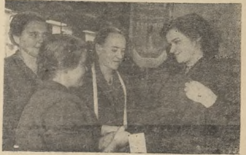
Высоких показателей добилась в социалистическом соревновании в честь XXI съезда КПСС бригада № 4 швейной фабрики. Январский план выполнен ею на 110 процентов.

Делегаты и гости встают и с огромным воодушевлением поют партийный гимн „Интернационал“. В зале вспыхивает и долго не смолкает бурная овация. Под сводами дворца раздаются здравицы в честь Коммунистической партии Советского Союза, в честь единства всех марксистско-ленинских партий, дружбы народов социалистических стран, за мир во всем мире, звучат возгласы: „Да здравствует коммунизм!“.